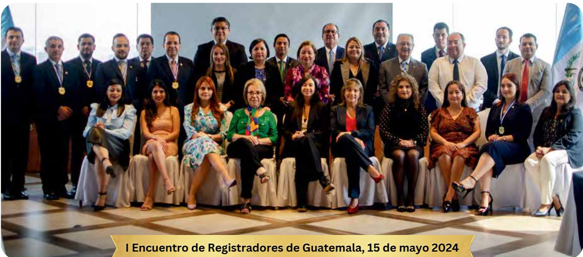
I Encuentro de Registradores de Guatemala, 15 de mayo 2024